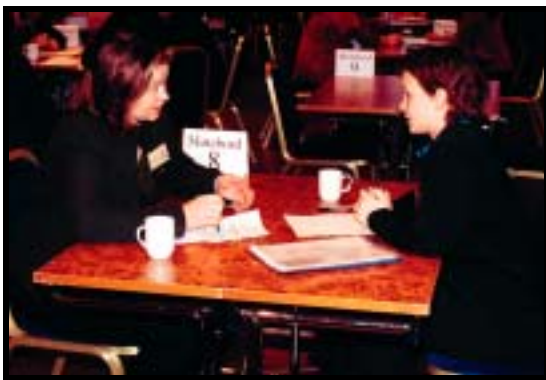
Kontakter blir knyttet.

↓ Det ble gjennomført 96 forhånds avtalte samtaler