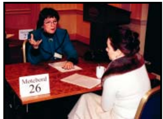
Råd blir gitt.