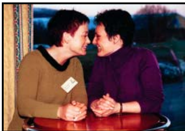
Venninner med blick for kro virksomhet

—Det var flere som ønsket å snakke med oss angående vår bedrift. Tenk at vi hadde verdifull in-