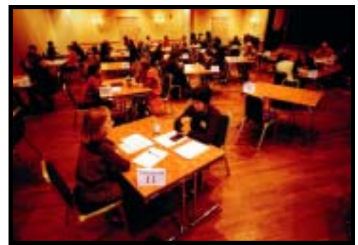
Praten går ivrig rundt bordene.

”Et viktig mål for Martekonferansen 2000 var nettverksbygging. Dette ønsket styringsgruppen å oppnå bl. a. gjennom møtebooking . De ca 100 deltakerne fikk mulighet til å ”melde seg på” samtale med andre deltakere, eller representanter for offentlige kontor og institusjoner. Det var mulig å avtale maks syv samtaler, men de fleste valgte å sette av tid til en kort lunsj innimellom. Det var satt av 15 – 20 minutter til hver samtale. Hensikten var å knytte kontakter og gi mulighet til å avtale videre kontakt senere.