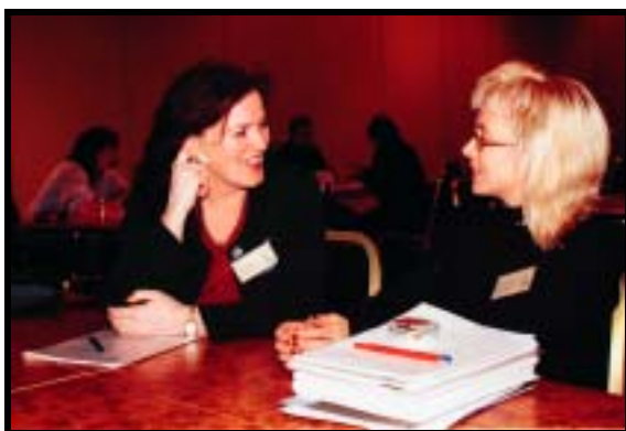
Tid for en avslappet prat.

↓ 85 % av de som var tilgjengelig for samtale valgte å bruke muligheten en eller flere ganger